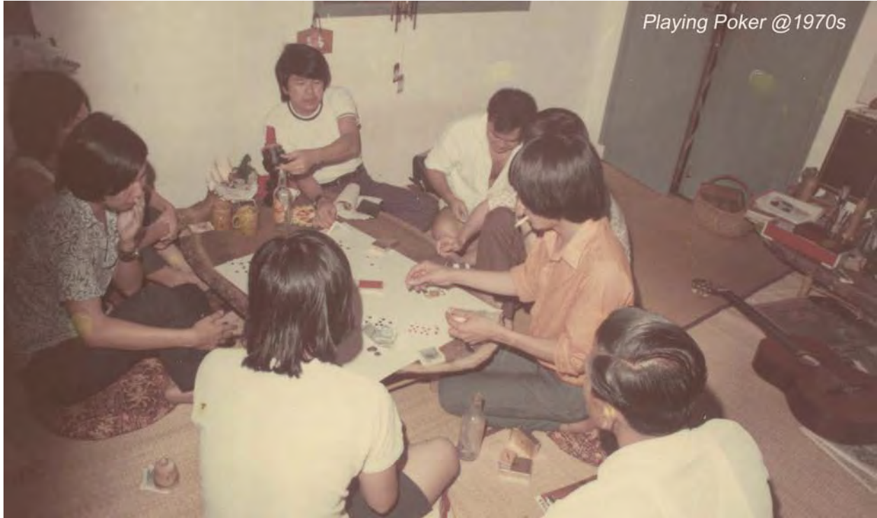
Playing Poker @1970s