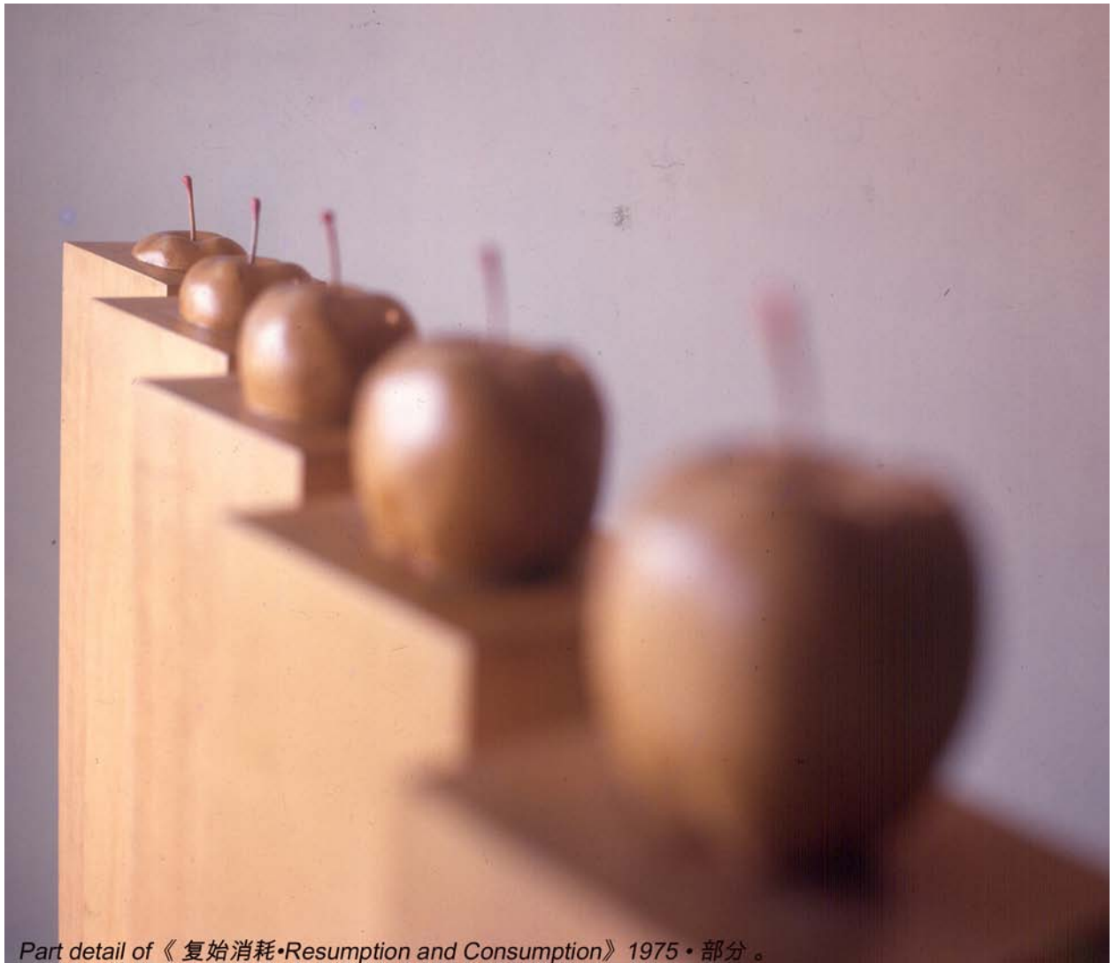
Part detail of 《复始消耗•Resumption and Consumption》1975 • 部分。